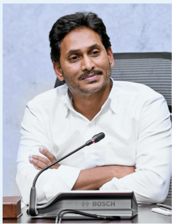
విశాఖపట్టణం, జనవరి 12 (భారత శక్తి)