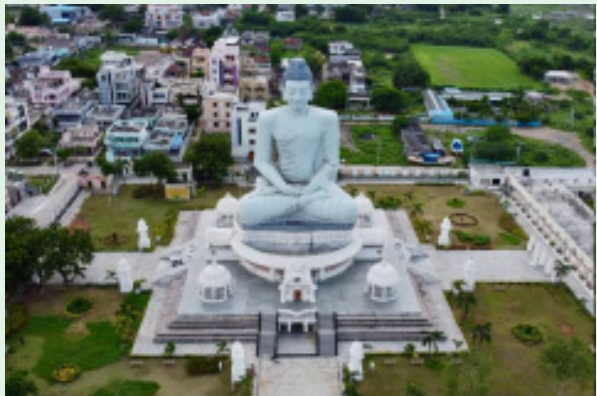
అమరావతి, జనవరి 12

అమరావతి రాజధాని విషయంలో వైఎస్సార్ కాంగ్రెస్ పార్టీ, ఆ పార్టీ అధినేత వైఎస్ జగన్ మోహన్ రెడ్డి అవలంబిస్తున్న తీరు రాజకీయ వర్గాల్లోనే కాకుండా సామాన్య ప్రజల్లోనూ తీవ్ర చర్చకు దారితీసింది. ఒక ప్రధాన రాజకీయ పార్టీ రాష్ట్ర భవిష్యత్తుకు సంబంధించిన కీలకమైన అంశంపై కాలక్రమేణా తన వైఖరిని మార్చుకుంటూ రావడం, ఆ పార్టీ రాజకీయ పరిపక్వతను, విశ్వసనీయతను ప్రశ్నార్థకం చేస్తోంది. రాష్ట్ర విభజన తర్వాత ఆంధ్రప్రదేశ్ అసెంబ్లీ సాక్షిగా అమరావతిని రాజధానిగా నిర్ణయించినప్పుడు, అప్పటి ప్రతిపక్ష నేతగా జగన్ మోహన్ రెడ్డి హృదయపూర్వకంగా ఆమోదం తెలిపారు. రాజధాని కనీసం 30 వేల ఎకరాల్లో ఉండాలి, అప్పుడే అది మహా నగరమవుతుంది అని ఆనాడు ఆయన చేసిన ప్రకంగాలు నేటికీ రికార్డులో ఉన్నాయి. అయితే, అధికారంలోకి వచ్చిన తర్వాత అదే 33 వేల ఎకరాల సేకరణను తప్పుబట్టడం, దానిని ఒక రియల్ ఎస్టేట్ కుంభకోణంగా చిత్రించడం ప్రజల్లో మొదటి అసమాన బీజాన్ని నాటింది. 2019 ఎన్నికల ప్రచారంలో చంద్రబాబు కంటే గొప్పగా అమరావతిని నిర్మిస్తాం అని ప్రజలకు హామీ ఇచ్చి అధికారంలోకి వచ్చిన జగన్, అనూహ్యంగా మూడు రాజధానుల నివాదాన్ని తెరపైకి తెచ్చారు. వికేంద్రీకరణ పేరుతో అమరావతిని కేవలం