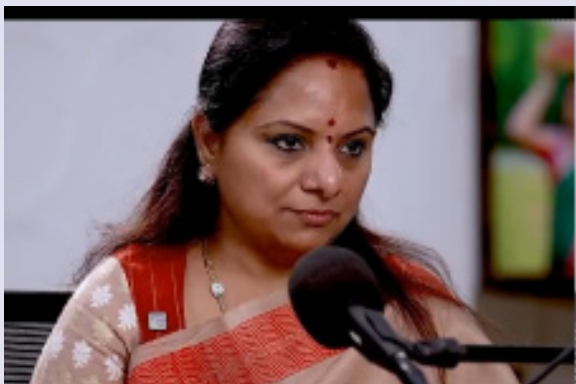
హైదరాబాద్, జనవరి 12, (భారత శక్తి)

రాజకీయాలలో ముఖ్యంగా కుటుంబాలు నడిపి పార్టీలలో అంతర్గతంగా కుమ్మూటలు చోటు చేసుకోవడం మనదేశంలో కొత్తేమీ కాదు. గతంలో కాంగ్రెస్ పార్టీ లో సంజయ్ గాంధీ వ్యవహారం వైకి ఈ దేశ ప్రజలకు సుపరిచితమే. తమిళనాడులో డిఎంకే, ఉత్తర్ ప్రదేశ్ లో సమాజ్ వాదీ పార్టీ, ఉమ్మడి ఆంధ్రప్రదేశ్లో తెలుగుదేశం పార్టీ.. ఇలా చెప్పుకుంటూ పోతే ఎన్నో ఉదాహరణలు.. అంతిమంగా అధికారం కోసం, అలవిమావిన సంపాదన కోసం జరిగే పోరాటాలు ప్రాంతీయ కుటుంబ పార్టీల అసలు బాగోతాన్ని బయటపెడతాయి. ఇప్పుడు ఈ జాబితాలోకి భారత రాష్ట్ర సమితి కూడా చేరింది. 2014లో అధికారంలోకి వచ్చిన భారత రాష్ట్ర సమితి.. తెలంగాణలో వ్యవస్థలను ఎంత