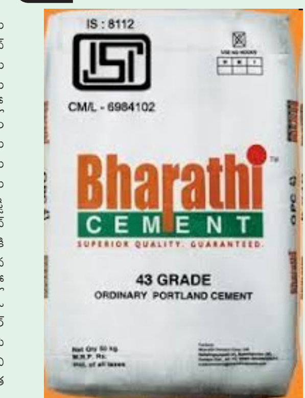
చేయాలని రాష్ట్రానికి కేంద్రం లేఖ రాసింది. దీంతో అసలు విషయం బయటపడింది. రాష్ట్ర ప్రభుత్వం నోటీసులు ఇవ్వడంతో పరిశ్రమలను తరిమేస్తున్నారన్న ప్రచారం మొదలుపెట్టారు జగన్.

కేటాయింపు చేసుకున్న భూముల లీజు విషయంలో నోటీసులు మాత్రమే ఇచ్చింది. దానిని వేధింపులుగా భావిస్తున్నారని జగన్మోహన్ రెడ్డి. జగన్ అధికారంలో ఉన్నప్పుడే తన కుటుంబ సంస్థలకు నిబంధనలకు విరుద్ధంగా వేల కోట్ల రూపాయల విలువైన గనులను కట్టబెట్టారు. భారతి సిమెంట్స్ కు కేటాయించిన లీజులో నిబంధనలను ఉల్లంఘించారని తేలడంతో.. కూటమి ప్రభుత్వం ఆ లీజులను రద్దు చేసేందుకు సిద్ధపడింది. దానిని పరిశ్రమలను తరిమివేయడం అంటారా? అనలు భారతి సిమెంట్స్ ఏర్పాటు అక్రమమని ఆరోపణలు ఉన్నాయి.. భారతి సిమెంట్స్ అసలు పేరు అది కాదు. రఘురాం సిమెంట్స్. 2004లో రాజశేఖర్ రెడ్డి ముఖ్యమంత్రి అయిన తరువాత.. ఆయన కుమారుడు జగన్మోహన్ రెడ్డి ఆ కంపెనీని కొనుగోలు చేశారు. రఘురాం సిమెంట్స్ కంపెనీకి సున్నపురాం లీజులు ఉన్నాయి. భారతి సిమెంట్స్ గా మారిన తర్వాత ఆ లీజులను ఆ కంపెనీ వాడుకుంది. ఇటువంటి పరిస్థితుల్లో గనుల విషయంలో కేంద్రం స్పష్టమైన పాలసీని తీసుకొచ్చింది. ఓ కంపెనీ పేరుతో లీజులు తీసుకొని.. మరో కంపెనీ టేక్ ఓవర్ చేస్తే లీజులు చెల్లవు అని స్పష్టం చేసింది. 2017లో అప్పటి టిడిపి ప్రభుత్వం రఘురాం సిమెంట్స్ను ఇచ్చిన ప్రాథమిక అనుమతిని కూడా రద్దు చేసింది. 2019లో ఏపీలో అధికారం మారిన తర్వాత సీన్ చేంజ్ అయింది. కొన్ని రకాల న్యాయపరమైన అంశాలను తెరపైకి తెస్తూ లీజులను పునరుద్ధరించుకున్నారు. అయితే హైకోర్టు ఈ విషయంలో కొన్ని రకాల సూచనలు చేసిన పట్టిండుకోలేదు. సరిగ్గా 2024 ఎన్నికలకు ముందు లీజులను పునరుద్ధరిస్తూ జీవోలు జారీచేశారు. దీనిపై కేంద్రానికి ఫిర్యాదు వెళ్ళింది. విచారణ